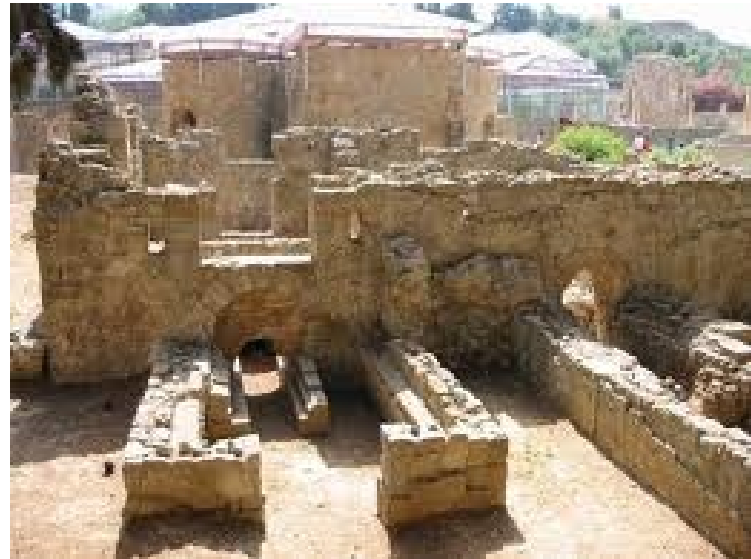
Villa del Casale