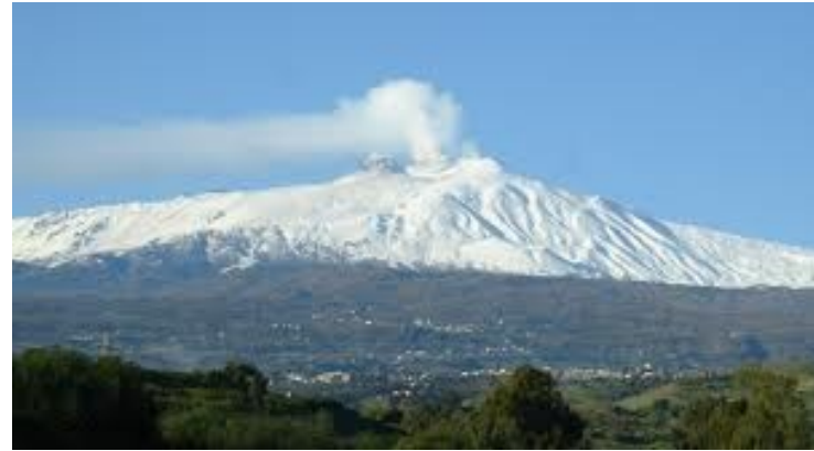
Etna in inverno

La città ha un aspetto barocco ed è famosa per le sue attrezzature sciistiche e per le terme di San Venera.