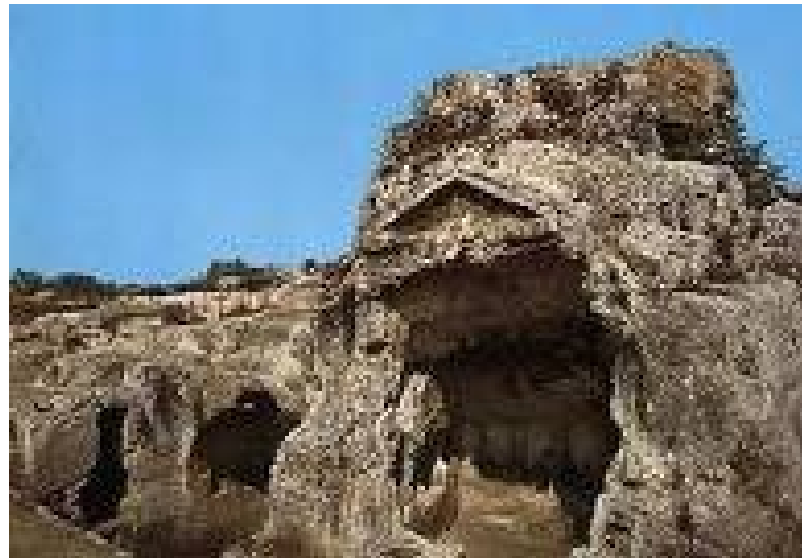
terme di San. Venera